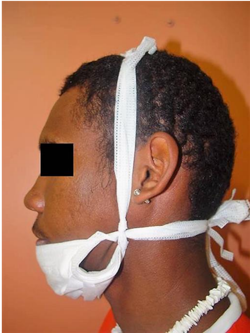
Figure 2: The surgical mask in position. We use two superposed mask for more stability.