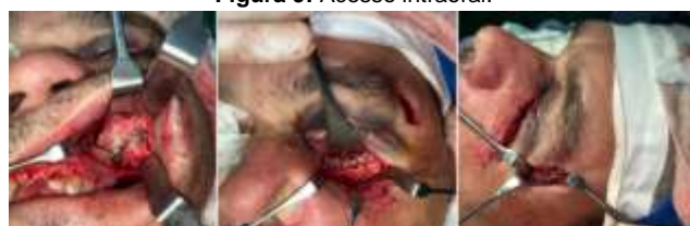
Figuras 10: Redução e osteossíntese dos pilares nasomaxilar, zigomaticomaxilar (A), rima infraorbital (B) e frontozigomático (C).

Após fixação foi notado boa estabilidade do complexo e reestabelecimento da oclusão de forma satisfatória, sendo então, realizado as suturas dos acessos superciliar e subtarsal em seus planos profundos com pontos interrompidos com Vicryl® 4-0 (Ethicon, Johnson & Johnson Medical Devices, São Paulo - Brasil) e em derme sutura contínua intradérmica com nylon 5-0. No acesso intraoral foi realizada sutura interrompida em planos profundos com Vicryl® 4-0 e em mucosa, foi realizada sutura contínua festonada com Monocryl® 4-0 (Ethicon, Johnson & Johnson Medical Devices, São Paulo, Brasil).