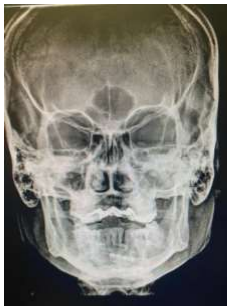
Figura 6: Radiografia pósterio-anterior de face.

Foram realizados os acessos subtarsal visando a fratura infraorbitária, o acesso superciliar objetivando a fratura em sutura frontozigomática (Figuras 7 e 8) e o acesso intraoral (Figura 9) observando as fraturas em pilares zigomaticomaxilar e nasomaxilar. Foi realizada, então, a redução das fraturas e fixação com placas e parafusos de titânio do sistema 1.5 do pilar frontozigomático, rima infraorbitária, pilar zigomaticomaxilar e nasomaxilar (Figura 10), respectivamente.