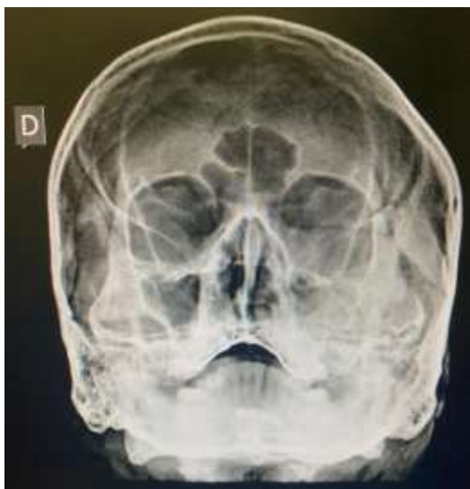
Figura 4: Radiografia pósterio-anterior de Waters.