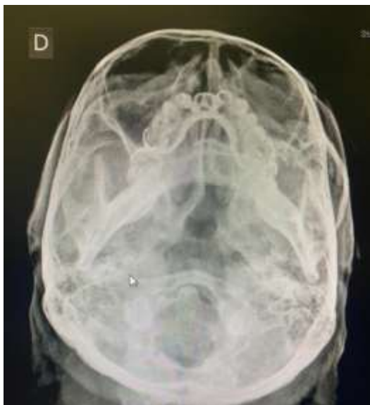
Figura 5: Radiografia axial de Hirtz para arco zigomático.