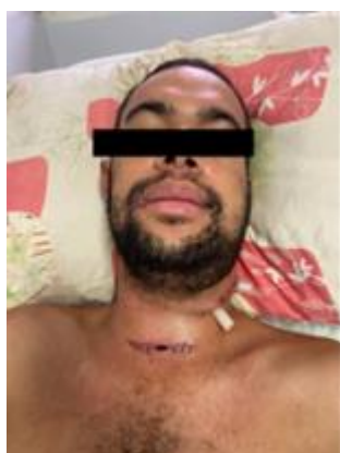
Figura 9: Aspecto clínico dos curativos.

Logo, para seguir o bom prognóstico foram feitas as seguintes recomendações: troca do