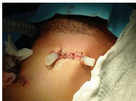
Figura 5: Aspecto extrabucal do dreno instalado.

Com isso, já no centro cirúrgico, foi submetido à traqueostomia sob anestesia local, drenagem de abscesso cervical e extração dos elementos 36 e 38 sob anestesia geral. O procedimento ocorreu de forma positiva e sem nenhuma intercorrência, e durante o ato cirúrgico, foi feita coleta de amostra para cultura, antibiograma e bacterioscopia, os quais tiveram como resultado a presença de Staphylococcus spp. (Figuras 5 a 9)