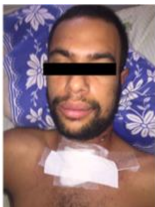
Figura 7: Aspecto clínico dos curativos.