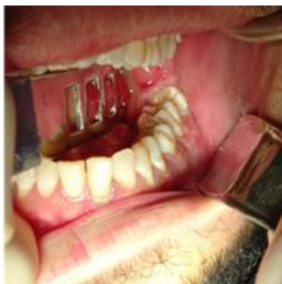
Figura 6: Aspecto intrabucal do dreno rígido instalado.