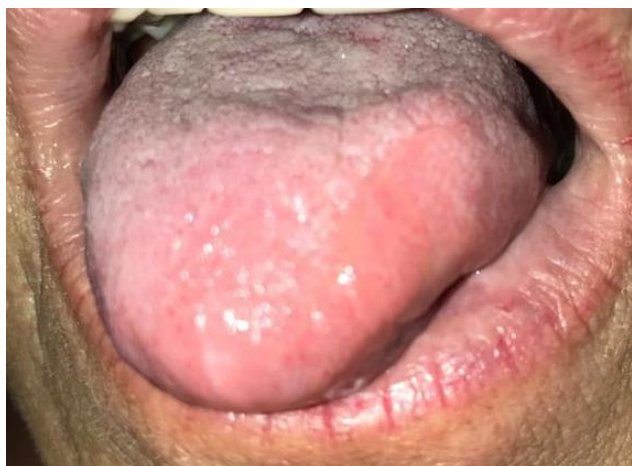
Figura 5: Aspecto pós-operatório de controle de 6 meses.

Não foi visualizado qualquer sinal de recidiva da lesão, dentro do período de controle de seis meses, mantendo-se função habitual da língua, com relato de ausência de dificuldade na mastigação, que era a queixa principal da paciente (Figura 5).