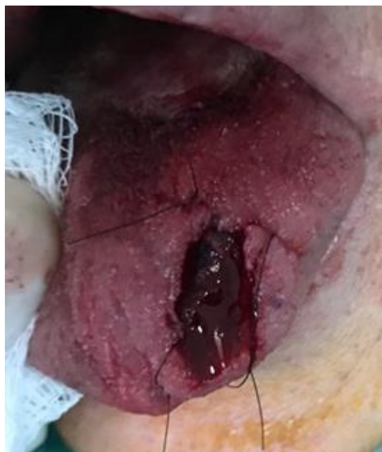
Figura 2: Contenção por meio de sutura visando diminuir o fluxo sanguíneo local.

Confirmada a natureza vascular da lesão, optou-se pela abordagem cirúrgica. Estável hemodinamicamente, a paciente foi submetida à biópsia excisional sob anestesia local em ambiente ambulatorial. Foram realizadas suturas na base da lesão, a fim de diminuir o aporte sanguíneo local, propiciando menor sangramento no transoperatório (Figura 2). A excisão completa da lesão foi realizada, notando-se ausência de comprometimento dos tecidos adjacentes (Figuras 3 e 4).