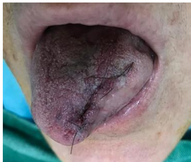
Figura 4: Região cirúrgica após remoção da lesão com suturas isoladas.