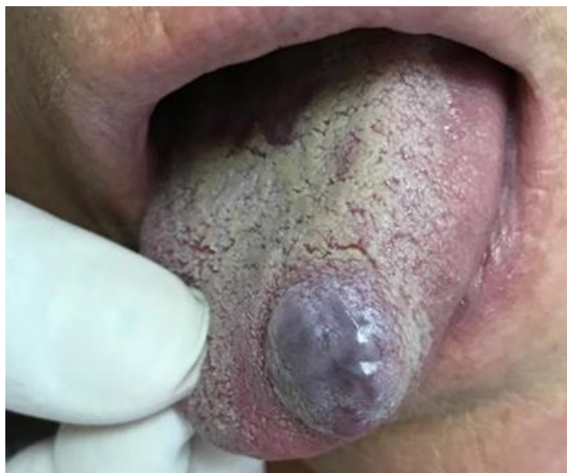
Figura 1: Aspecto clínico inicial da lesão.

Na história médica e no exame físico extraoral não havia nada digno de nota. Ao exame físico intraoral, foi observada uma lesão nodular, de coloração arroxeada, de aspecto moriforme, com aproximadamente 1,5cm de diâmetro, de implantação séssil, circunscrita, resiliente à palpação, assintomática, localizada em região do terço anterior de dorso lingual do lado esquerdo (Figura1).