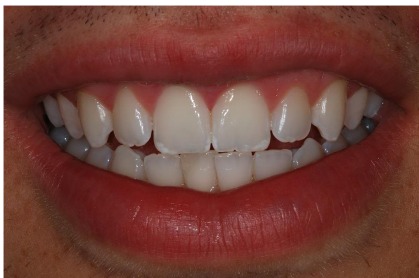
Figura 9. Aspecto inicial do sorriso de um paciente com manchamento na incisal dos dentes superiores, principalmente nos incisivos centrais.

Paciente do gênero masculino, 20 anos, buscou atendimento odontológico queixando-se das “manchas brancas nas pontas dos dentes da frente” (Figura 9).