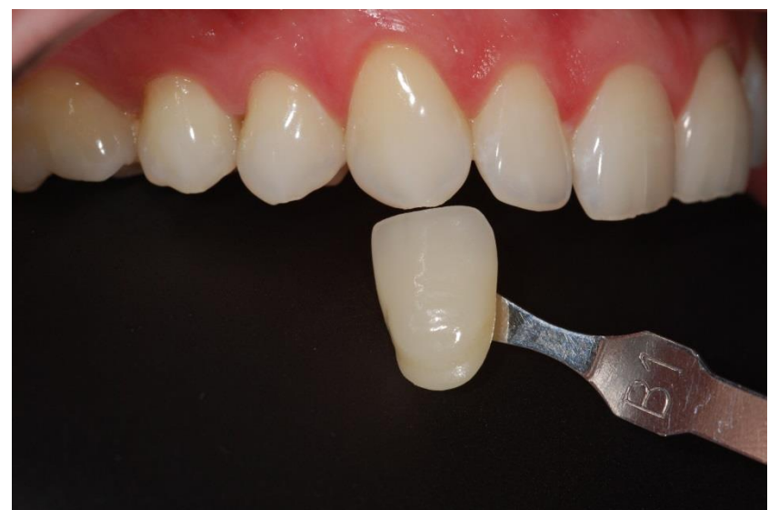
Figura 7. Avaliação final da cor dos caninos que também foram classificados com a cor B1.

O paciente não relatou sensibilidade durante o tratamento e, ao final, se declarou satisfeito com a