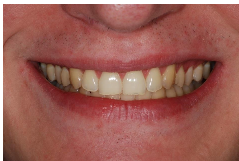
Figura 1. Aspecto inicial do sorriso.

Paciente do gênero masculino, 21 anos, procurou o tratamento odontológico queixando-se da “aparência amarelada” do seu sorriso (Figuras 1 e 2).