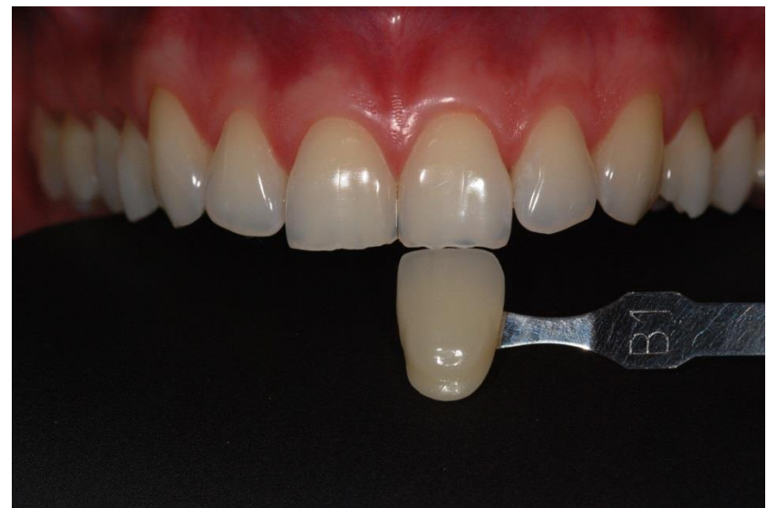
Figura 6. Avaliação final da cor em que todos os dentes foram classificados com a cor B1.

Por se tratar de um paciente jovem, foi preconizado o tratamento clareador caseiro utilizando peróxido de carbamida 10% (Whiteness Perfect; FGM Produtos Odontológicos, Joinville, SC, Brasil). Para tanto, moldeiras individuais em silicone foram confeccionadas a partir da moldagem prévia do paciente e o clareador, foi utilizado durante a noite, durante 8 horas por dia, por três semanas. Após esse período, pôde-se perceber o clareamento generalizado dos dentes de ambas as arcadas (Figura 5), inclusive com igualdade de cor entre os caninos, antes os mais escurecidos, com os demais dentes, uma vez que todos foram classificados com a cor B1 da Escala Vita na avaliação pós-clareamento (Figuras 6 e 7).