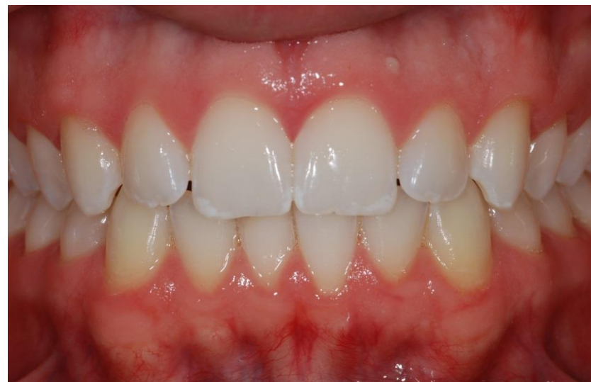
Figura 10. Visão intrabucal dos dentes e avaliação do manchamento, que foi diagnosticado como hipoplasia dental.

apresentavam o aspecto leitoso e circunscrito, comum das manchas de hipoplasia profundas.