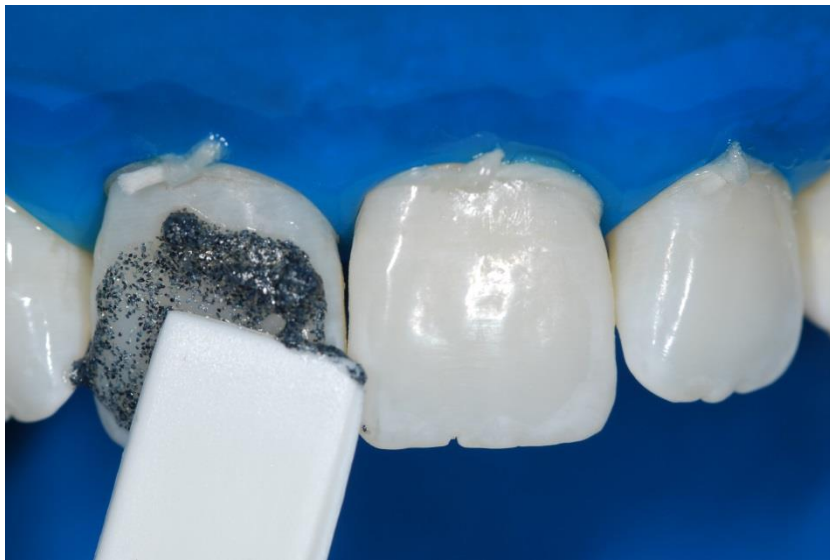
Figura 11. Aplicação do sistema microabrasivo com espátula plástica sob pressão manual.

FGM Produtos Odontológicos) (Figura 12).