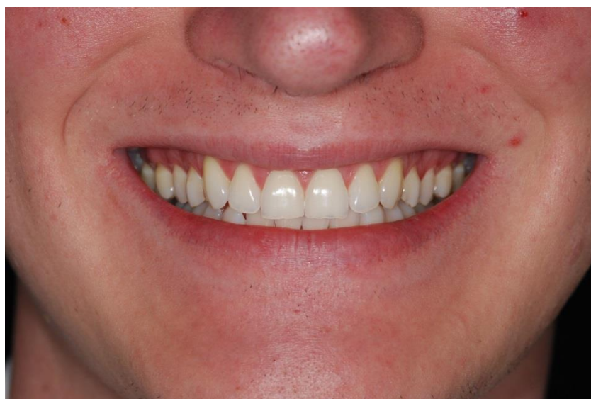
Figura 8. Aspecto final do sorriso após o tratamento clareador.

nova cor dos dentes e aparência do sorriso (Figura 8).