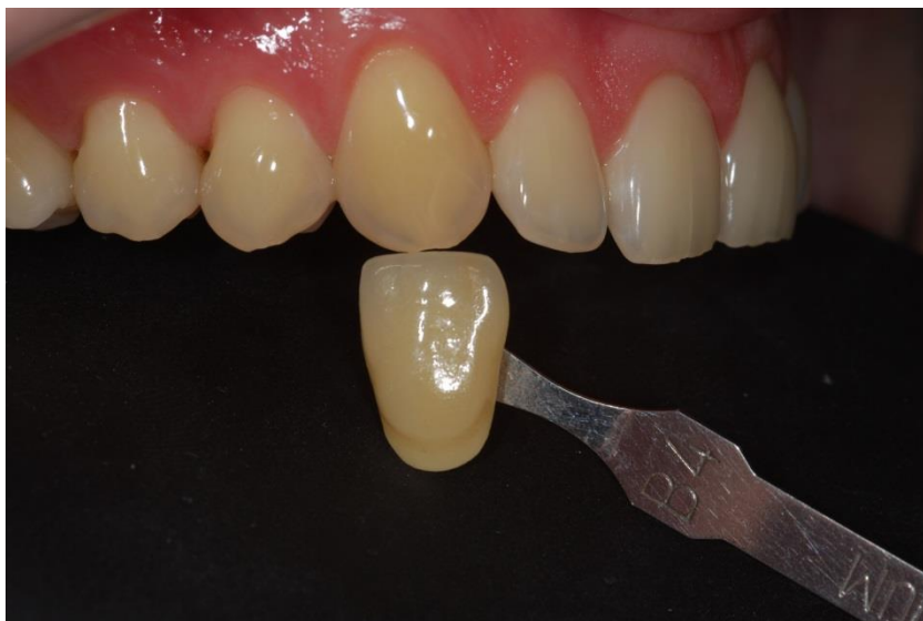
Figura 4. Avaliação de cor dos caninos que foram classificados como B4.