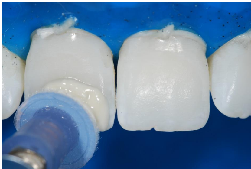
Figura 12. Polimento final dos dentes após a técnica de microabrasão.

Ao final, pôde-se observar o sucesso do tratamento com remoção das manchas brancas e evidenciação das características de cor e translucidez características da região incisal dos dentes (Figuras 13 e 14).