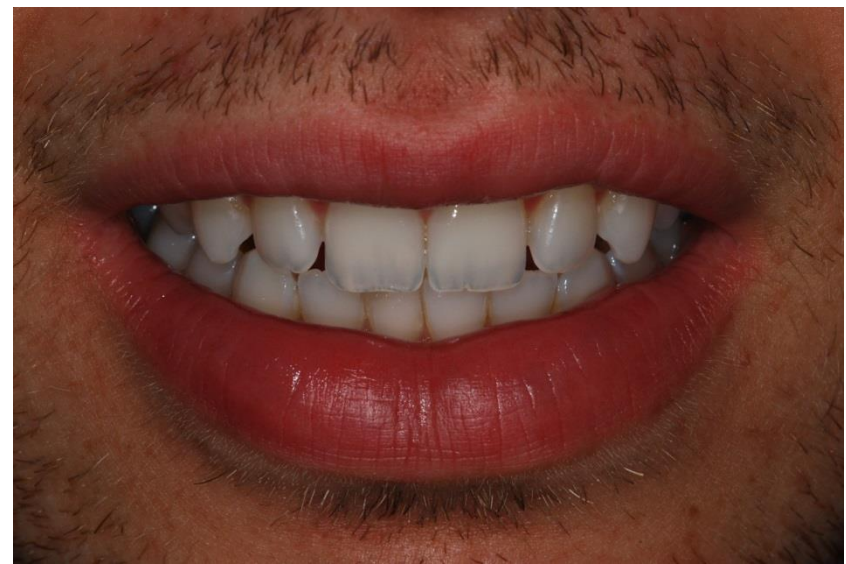
Figura 14. Aspecto final do sorriso após o tratamento de microabrasão.