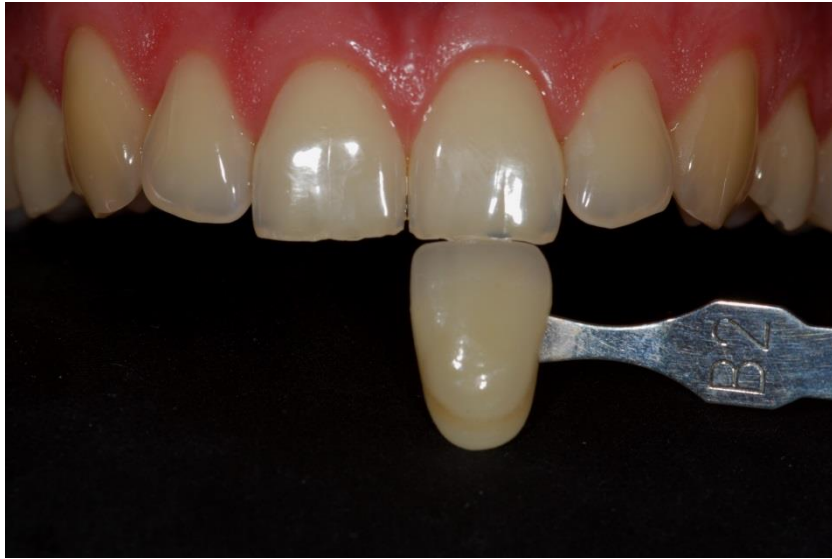
Figura 3. Avaliação inicial da cor por meio de escala de cor em que os incisivos foram classificados com a cor B2.

cor dos dentes, pode-se observar um manchamento generalizado, sem a presença de manchas localizadas, o que caracteriza um caso de pigmentação de origem extrínseca. Na tomada de cor utilizando a escala Vita, foram selecionadas as cores B2 para os incisivos (Figura 3) e B4 para os caninos (Figura 4).